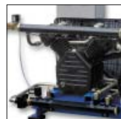
Scambiatore di calore interstadio