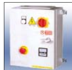
Quadro con avviatore stella-triangolo