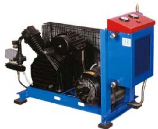
Serie PH: compressori alternativi lubrificati, con portata da 12 a 46 m 3 /h, pressioni di mandata da 15 a 35 bar.

I booster funzionano in completa autonomia: sono equipaggiati con elettrovalvola d'aspirazione, elettrovalvola di scarico, antivibranti, raffreddatore finale con elettroventilatore integrato, separatore di condensa con scaricatore elettronico, manometro d'aspirazione, manometro di mandata, teleavviatore stella-triangolo, prefiltro d'aspirazione, valvola di ritegno e pressostato.