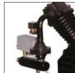
Elettrovalvola di scarico e manometro di mandata

* tutti i serbatoi disponibili in versione fissa con piedini, o mobile carrellata.