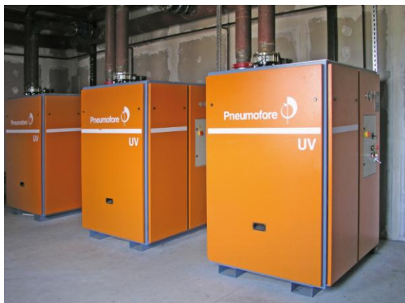
Figure n° 3 - Pompes à vide rotatives à palettes mod. UV16

En 1998, Pastificio Garofalo, à Gragnano, dont la qualité des pâtes est indiscutable, installe sa première pompe UV16 afin de remplacer les trois pompes à anneau liquide d'eau. En plus de résoudre ses problèmes liés à la gestion de l'eau, Pastificio Garofalo réduit également sa consommation d'électricité de 15%. À débit égal, le degré de vide a augmenté et la qualité s'est améliorée. Aujourd'hui, cet établissement compte sept unités UV16 BP et une unité UV8 BP, preuve de la fiabilité, de la constance des rendements et de l'économie d'énergie garantis par les systèmes à vide Pneumofore et qui se reflètent dans la qualité irréprochable du produit fini.