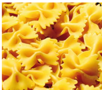
Figure n° 2 - Type de pâte appelé « Farfalle »

Chaque ligne de production dispose de son propre mélangeur, à l'intérieur duquel la farine de blé dur est mélangée avec l'eau à l'aide de systèmes informatisés de manière à optimiser le mélange destiné à la fabrication des différents types de pâtes. Au bout de 20 minutes environ, la pâte est transférée dans un mélangeur plus petit appelé « le sous vide ». Ensuite, une vis hélicoïdale pousse la pâte contre la filière (différente pour chaque format) sous laquelle un couteau coupe les pâtes selon la longueur souhaitée. Des filières en teflon ou en bronze sont ensuite utilisées pour obtenir des pâtes à surface rugueuse, les préférées des gourmets car elles absorbent mieux la sauce. La création du vide dans le mélangeur permet de réduire l'humidité de la pâte dès cette étape.