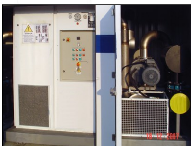
UV16 H con roots booster

El proyecto fue dirigido por un equipo de trabajo entre varias oficinas de ingenierías, una colaboración de ingenieros de Australia, Dubai, Italia, EEUU y India. Los provechos de esta solución de vacío para secar son evidentes, puesto que los camiones pueden ser desplazados con facilidad, solo necesitan energía eléctrica gracias a generadores, ningún agua de recirculation, ningún alto costo de inversión como tal vez pasa por grandes compresores combinados con varios secadores, no alto costos operativos debido a un bajo consumo energético. También tamaño y peso influyen en la fácil gestión de esos camiones listos para ser utilizados.